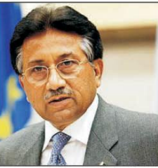
پرویز مشرف نے بھارت پر الزام لگایا کہ ایک منصوبہ بند سازش کے تحت ہمایہ ملک پاکستان کو کمزور کرنے کے منصوبے بنا رہا ہے تاہم پاکستانی فوج کسی بھی پہنچ کا مقابلہ کرنے کیلئے تیار ہیں۔ انہوں نے کہا کہ بھارت نے پاکستان کے خلاف دہرہ درج جنگ شروع کی ہے اگر بھارتی فوج نے ایک قدم بھی پاکستانی زیر انتظام کشمیر (بقیہ نمبر ۴)

سرینگر / سابق فوجی سربراہ نے اپنے مخصوص انداز میں بھارت کو متنبہ کرتے ہوئے سولہ ایہ انداز میں کہا کہ ”سکیلا کستان نے نیو کلیئر ہتھیار شہ برات کے موقع پر استعمال کرنے کیلئے بنائے ہیں؟۔ پاکستان سابق صدر نے بھارت کے خلاف سخت بیان دیتے ہوئے کہا کہ اگر بی جے پی حکومت نے پاکستان کے کسی بھی خطے میں جلدیت کا مظاہرہ کیا تو پاکستان اپنی ہتھیاروں کا استعمال کرنے سے گریز نہیں کرے گا۔ بے کے نیوز سروس مائٹنگ