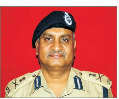
ڈائریکٹر جنرل پولیس نے انکشاف کیا۔ الفا نیوز سروس کے مطابق ڈائریکٹر جنرل پولیس نے آج پوراہ ضلع کا دورہ کیا اور وہاں سیکورٹی صورتحال کا جائزہ لیا اور افسران کی اعلیٰ سطحی میٹنگ سے بھی خطاب کیا جس کے دوران مجموعی سیکورٹی

صورتحال کی بحالی کو ترجیحی بنیادوں پر یقینی بنانے کی پولیس افسران کو ہدایت دی۔ ڈائریکٹر جنرل پولیس نے پولیس دہار کے دوران اس بات پر زور دیا کہ امن دشمن عناصر پر کڑی نگاہ رکھی جائے تاکہ وہ اپنے ناپاک عزائم کو یقینی بنانے میں کامیاب نہ ہو سکیں۔ انہوں نے کہا کہ وادی میں جو صورتحال پیدا ہو گئی ہے پولیس اور سیکورٹی ایجنسیوں سے نمٹ رہی ہیں۔ وادی میں تازہ بلاکتوں کے حوالے سے انہوں نے کہا کہ شمالی کشمیر میں بلاکتوں سے متعلق تحقیقات جاری ہے اور گزشتہ دنوں سرکاری ملازم کی بلاکت کی تحقیقات سے متعلق اہم سراغ پولیس کو ہاتھ لگ چکا ہے اور بہت جلد باپھر آئندہ پچھ روز کے اندر ہی صورتحال واضح ہوگی جس کے بعد حقائق کو سامنے لایا جائیگا۔ انہوں نے کہا کہ امن دشمن عناصر کیخلاف سختی کیساتھ کارروائی ہوگی اور ان کیساتھ کوئی بھی نرمی نہیں برتی جائیگی۔ ڈائریکٹر جنرل پولیس نے واضح کر دیا کہ پولیس اور (بقیہ نمبر ۳)